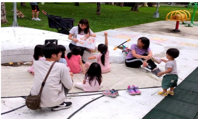
東興公園兒童福音

而十六大區有兩個年輕的兒童家，在領受負擔後願意打開家，開兒童排；不僅可以邀約許多鄰居的兒童，其中一位孩子上小學以後，更能邀約同學一起參加。我們盼望將公園福音所接觸到的兒童及家長，邀約到家中的兒童排。感謝主，求主使我們繼續藉着公園兒童福音、家中兒童排接觸人，將更多人帶進召會生活，使神的家得擴增。