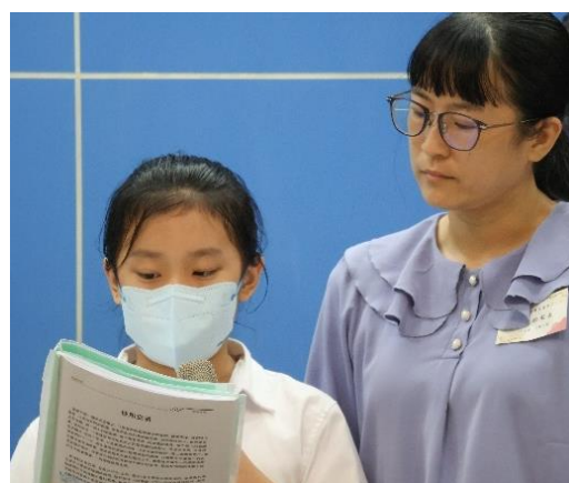
張詠愛與家長見證