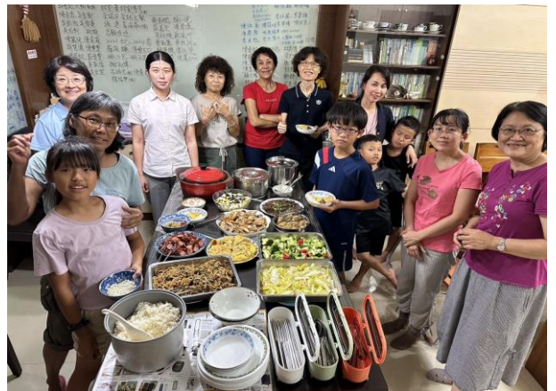
聖徒們週週愛筵溫暖並顧惜青職們

願主繼續祝福七大區，滿有繁增乳養的福，得着並餵養更多的青年人，使他們在召會生活中盡功用，一同被建造。