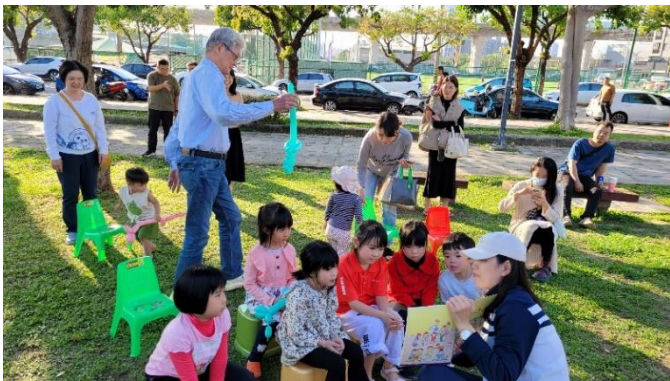
聖徒配搭摺氣球吸引兒童，兒童專心聽故事