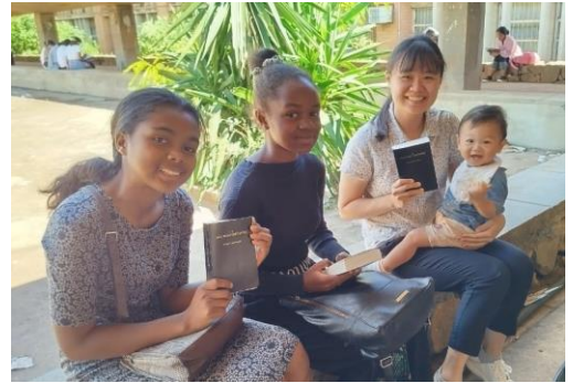
與安塔那那利弗大學的學生家聚會

為着在首都的校園中得着質高且向主絕對的青年人，我們與弟兄姊妹一同禱告了許久。在禱告的過程中，我們經歷父是源頭，是惟一的發起者。經過與弟兄們的交通後，我們於二月接續了在安塔那那利弗大學(University of Antananarivo)的校園開展。主為我們豫備了時間裝備語言、豫備了配搭開展的弟兄姊妹、豫備數量充足的法文聖經，我們更相信主要豫備敞開的器皿！