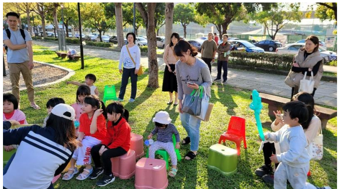
家長與兒童參與公園福音都很喜樂